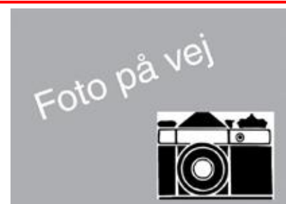
MOON DE NØR